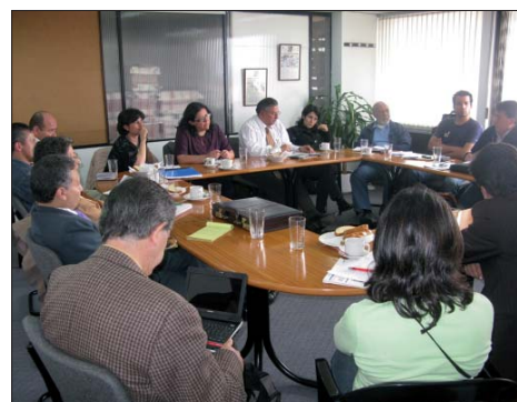
Reuniones preparatorias Cumbre Social y Política