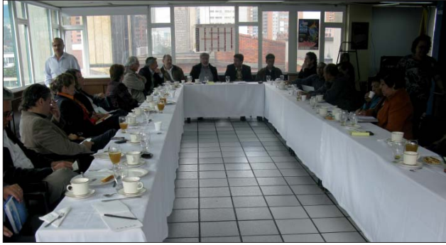
Con la asistencia de 18 Centros de Investigación, se constituyó en la CUT, el Equipo Nacional de Investigación de la Central.