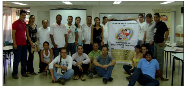
Reunión de jóvenes sindicalizados afiliados a la CUT.

Del mismo modo, el próximo 22 de agosto se lanzará la campaña "Por un rostro joven del sindicalismo colombiano" en la ciudad de Apartadó, Antioquia, como un reconocimiento a los más de 3 mil jóvenes afiliados a Sintrainagro en la región de Urabá. A este evento asistirán también los miembros del equipo de apoyo del Departamento de Niñez y Juventud Trabajadora de la subdirectiva CUT Antioquia, el cual se inauguró exitosamente el pasado 1º de julio, con la participación de jóvenes de 7 sindicatos de la región, entre ellos los que cuentan