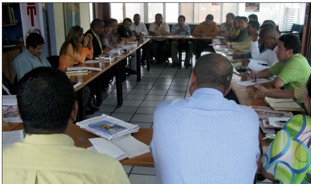
Encuentro de sindicatos de las Cajas de Compensación Familiar.