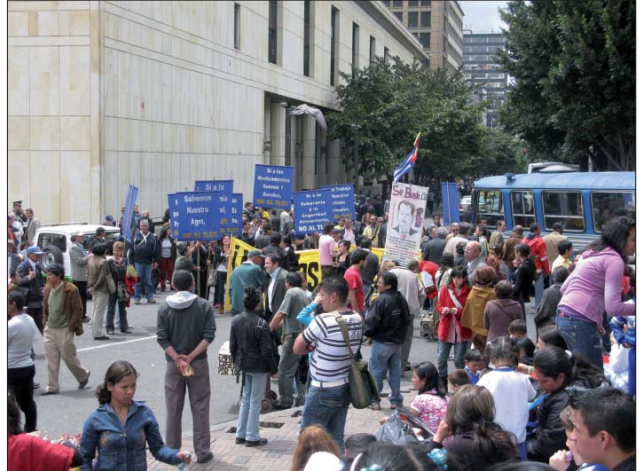
Movimientos sindicales, sociales y del sector agrario se manifiestan por la soberanía nacional y contra el TLC y las bases militares.