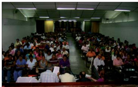
Cumbre departamental Antioquia