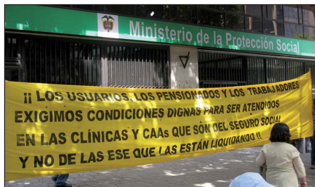
Los trabajadores se pronuncian en contra de la privatización de la salud

Así, como lo han venido denunciando las centrales sindicales, la Confederación de Pensionados de Colombia y los sindicatos de la entidad, entre otros, la liquidación de Cajanal dejando en la incertidumbre a tantos reclamantes y en la calle a los trabajadores de la entidad, es un acto irresponsable contra los derechos al trabajo y a la seguridad social.