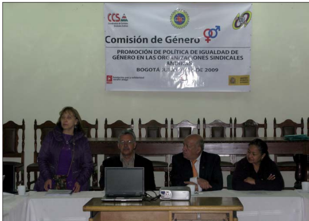
Seminario de la Confederación de Centrales Sindicales Andinas. Bogotá 9 y 10 de julio de 2009.