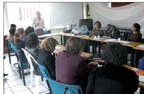
Reuniones preparatorias Cumbre Social y Política