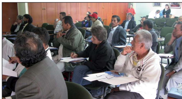
Encuentro de sindicatos del sector de la informalidad. Bogotá, 12 de agosto de 2009.