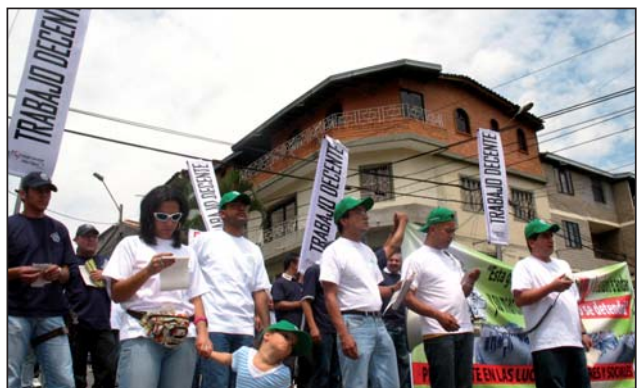
Colombia en la Jornada Mundial por el Trabajo Decente.