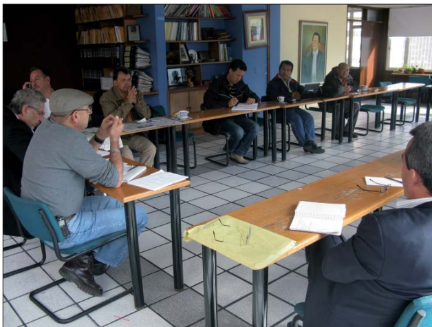
Reunión de la CUT con la comisión negociadora del pliego de peticiones de la USO.