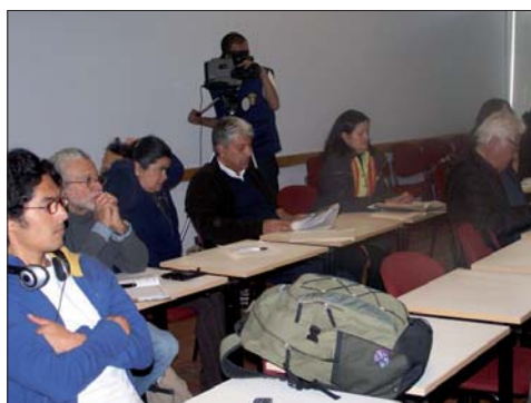
Mesa tema de Tierras, Conflicto y Narcotráfico

Compañeros(as) sindicalistas: ningún afiliado o sindicato de la Central debe quedarse sin participar en las cumbres departamentales, necesitamos el mayor número de delegados en la Cumbre Nacional de Organizaciones Sociales y Políticas... Contamos con ustedes.