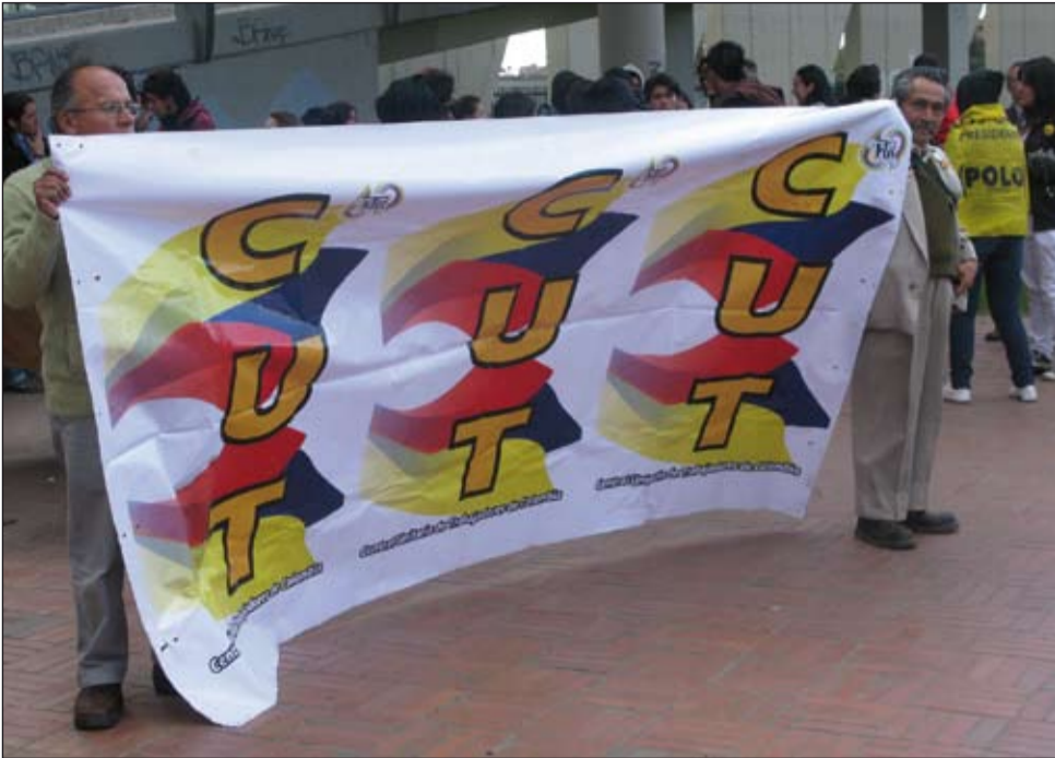
La CUT pide el inmediato retiro de las bases militares norteamericanas en Colombia.