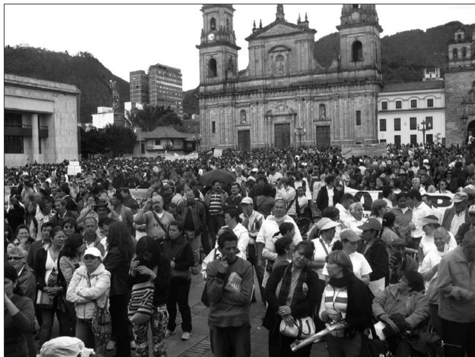
Gran toma de Bogotá el pasado 26 de agosto.

Una vez radicada dicha consulta ante la Sala de Consulta y Servicio Civil, el 16 de julio, el magisterio inició con convicción,