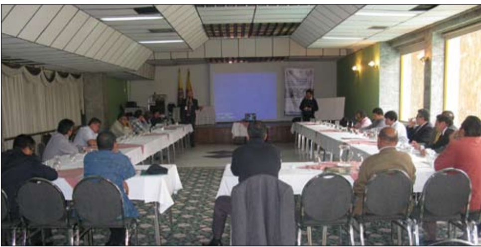
Arriba y abajo, aspectos del Seminario sobre la Ley de Oralidad en los procesos laborales y la aplicación práctica. Bogotá, septiembre 10 de 2009.