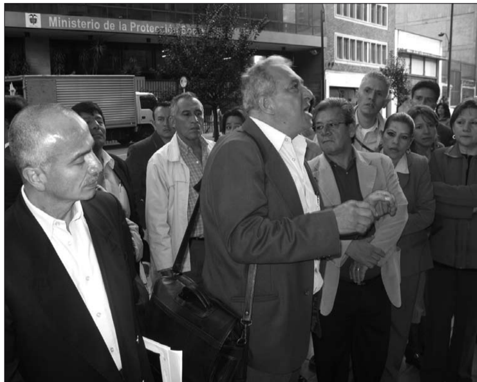
Mitin de empleados estatales frente a las instalaciones del Ministerio de la Protección Social en Bogotá, solicitando la suspensión de la convocatoria 001 de 2005 de la Comisión Nacional del Servicio Civil.

Esperamos que el gobierno y la Comisión Nacional del Servicio Civil entiendan la gravedad social que se avecina por la decisión de la Corte Constitucional y atiendan la representación de las organizaciones sindicales que tiene propuestas posibles para dar solución definitiva a esta situación, donde se requiere de la decisión política para lograrlo.