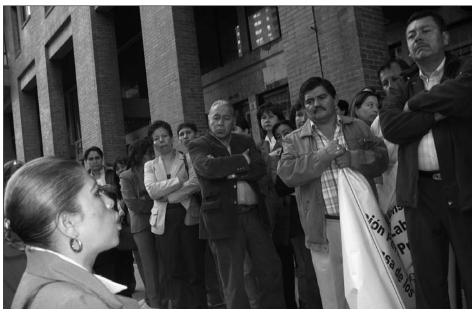
Los empleados estatales frente a las instalaciones del Ministerio de la Protección Social en Bogotá, solicitando la suspensión de la convocatoria 001 de 2005 de la Comisión Nacional del Servicio Civil.