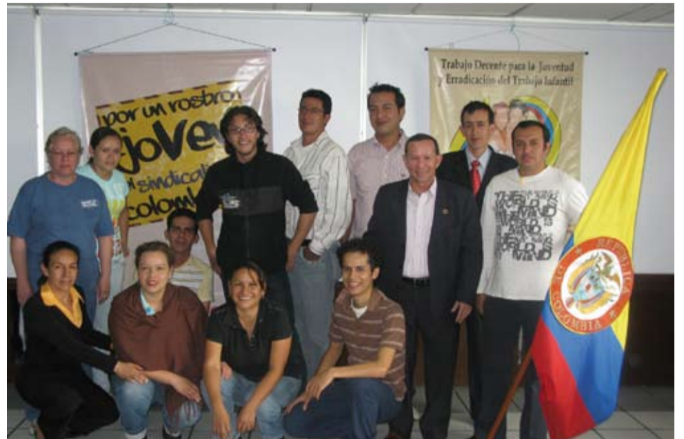
Curso de Formación de Formadores en Juventud y Sindicalismo. Bogotá, 31 de agosto y 1, 2, y 3 de septiembre.