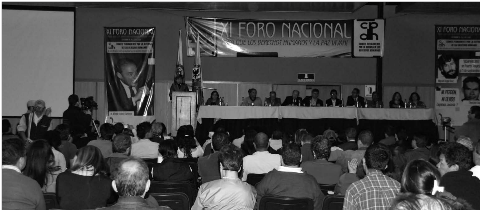
Foro Nacional por los derechos Humanos y La Paz, Bogotá, 10 11, 12 de septiembre de 2009.