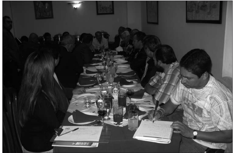
Reunión de los estatales con miembros de la Comisión Séptima del Senado de la República.

En agosto de 2007, por iniciativa del entonces presidente de la CUT, Carlos Rodríguez Díaz, se logra un acuerdo de la Central con todas las fuerzas políticas del Congreso de la República para solucionar definitivamente la estabilidad laboral de