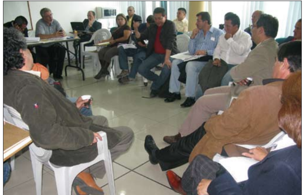
Reunión de la CUT con Sintrateléfonos, en defensa de la ETB.