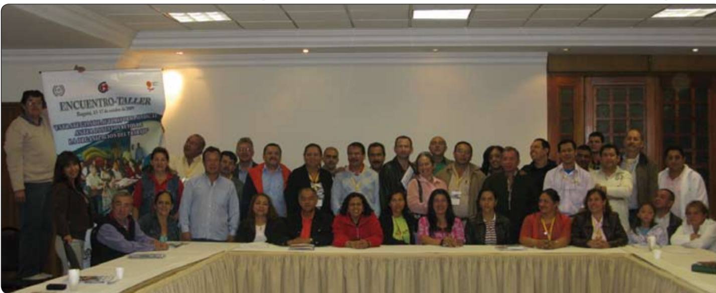
Encuentro-taller Estrategias de autoreforma sindical ante los nuevos retos de la organización del trabajo, Bogotá, 15 al 17 de octubre de 2009.