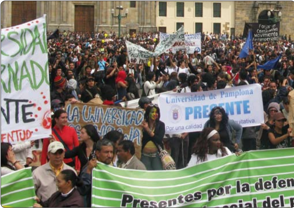
Miles de trabajadores y sectores sociales y populares, se movilizaron el pasado 14 de octubre en todo el país.