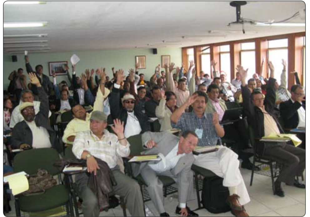
Por unanimidad aprobada declaración política de la XLV Junta Nacional de la CUT, que contó con la presencia de más de 110 delegados.