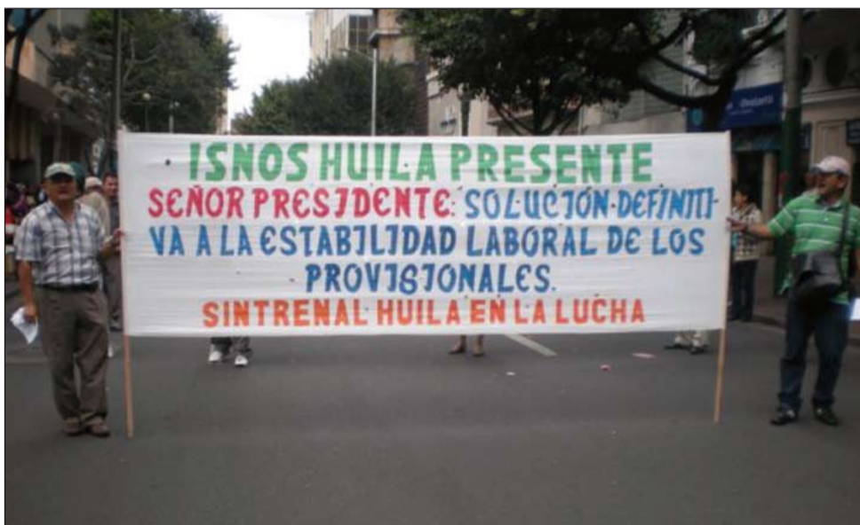
Aspecto de la movilización nacional de Sintrenal del 1 y 2 de octubre en defensa de la estabilidad laboral.

Este es el momento más difícil que hemos afrontado en la lucha por la estabilidad laboral, donde la convocatoria 01 de 2005 pareciera marchar a ritmos acelerados, pero de igual manera nada está totalmente perdido hoy. Se hace necesario mejorar la movilización social y política, con el fin de sacar adelante éstas y otras iniciativas que nos deben conducir a buen puerto.