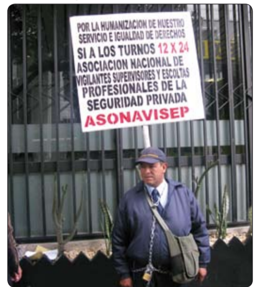
Vigilante protesta frente a las instalaciones del Ministerio de la Protección Social.