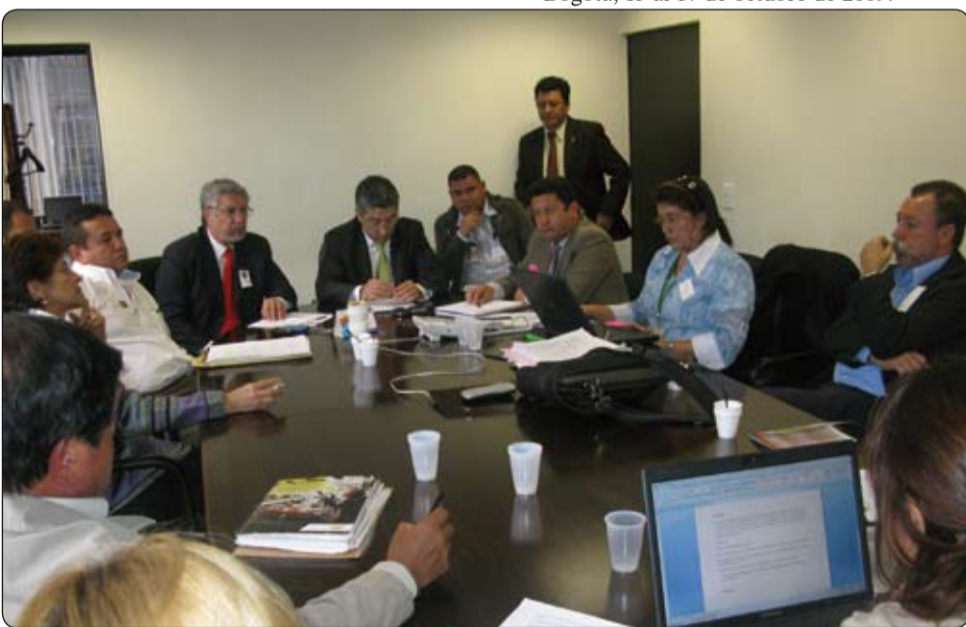
Audiencias laborales en el Ministerio de la Protección Social, el pasado 13 de octubre.