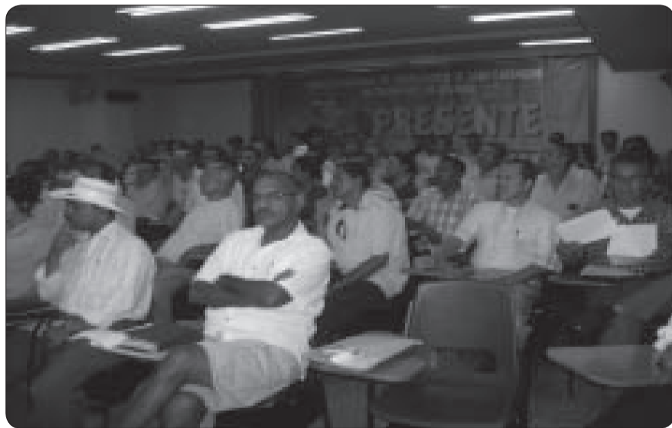
Asamblea de creación de la Subdirectiva Departamental de SNTT Antioquia.

El trabajo con la Unión General de Trabajadores Informales (UGTI), también refleja aportes importantes, la elección de su Comité Ejecutivo de 21 miembros y las acciones de movilización que se han venido desarrollando, nos permite asegurar que este proceso prontamente se consolidará a nivel nacional.