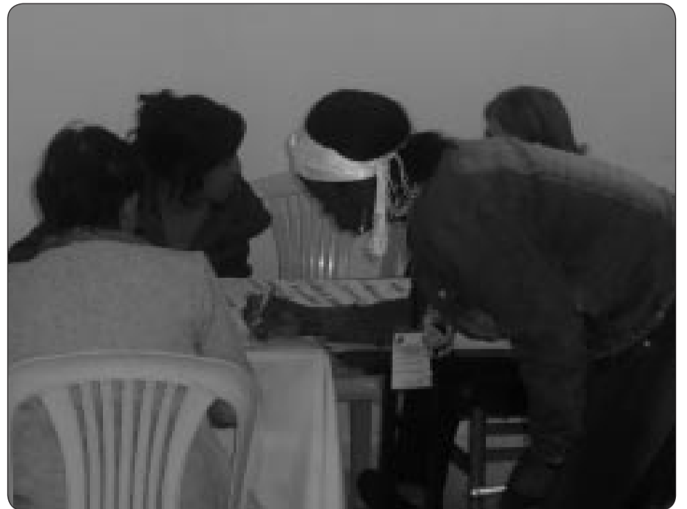
Durante sus encuentros, las mujeres en Colombia no se quedan atrás en la toma de decisiones, elaboran propuestas para lograr mayor reconocimiento en la sociedad.

En su Informe del 2008 sobre los Objetivos de Desarrollo del Milenio, se expresa que surgen oportunidades laborales, pero las mujeres quedan atrapadas en empleos menos estables y mal remunerados, en base a los datos recopilados sobre los tipos de