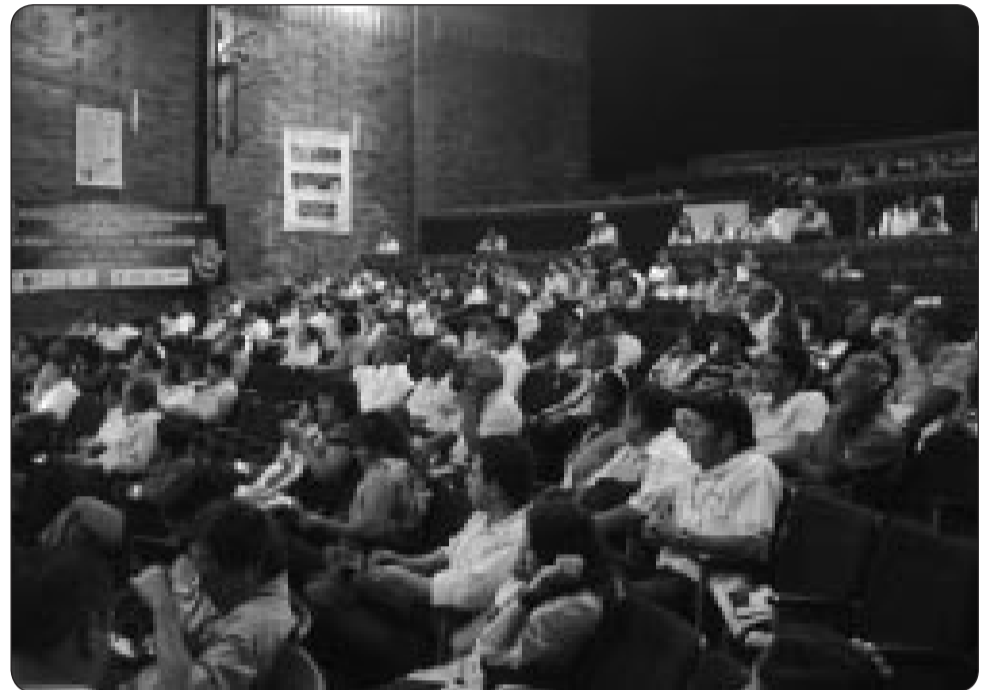
Familiares y víctimas de la violencia antisindical y organizaciones defensoras de los derechos humanos, en el II Encuentro Nacional de Víctimas realizado en la ciudad de Medellín.

El Encuentro se compromete a avanzar y fortalecer al movimiento nacional de víctimas de la violencia antisindical, con una agenda, participación de los departamentos y secretarías de derechos humanos, las subdirectivas desde las regiones y los