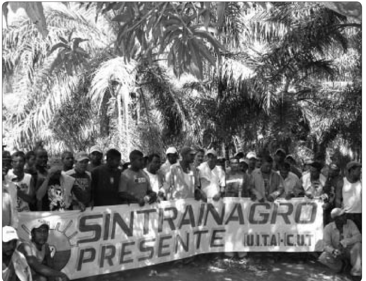
Aspecto de la Asamblea Extraordinaria.

De este proceso vivido con los trabajadores palmeros en el Magdalena, queda el mensaje claro, que el éxito es posible, incluso contra la criminalización de la lucha de los trabajadores y trabajadoras cuando se actúa con unidad férrea y se cuenta con el respaldo eficaz y oportuno como ocurrió en este caso con el Ejecutivo Nacional de la CUT y la Regional Latinoamericana de UITA.