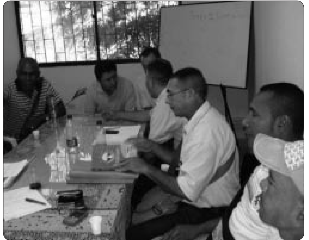
Comisión Negociadora Sintrainagro.

De esta forma, se da por solucionado el paro laboral y el sindicato orientó el reintegro inmediato a las labores, no sin antes, felicitar a los trabajadores y trabajadoras en huelga por la valerosa decisión unitaria de mantener el conflicto, no obstante la precariedad económica y las amenazas de los violentos para intimidarlo y romperlo.