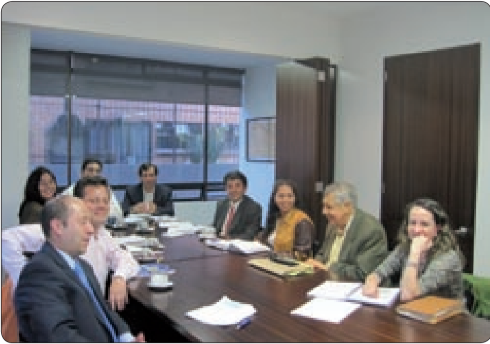
Comienza la negociación colectiva en el hospital San Ignacio con la organización Sintrasanignacio.