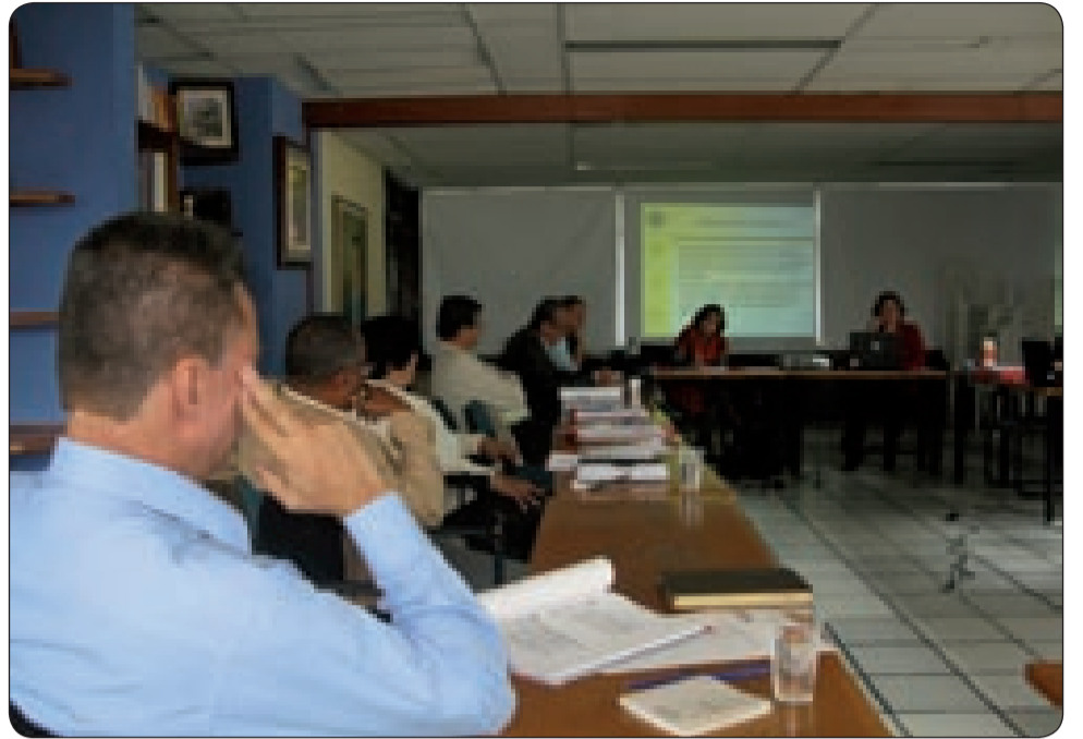
El Comité Ejecutivo de la CUT, en el seminario internacional La Importancia de la Perspectiva de Género en el Trabajo Sindical organizado por la Coordinadora de Centrales Sindicales Andinas (CCSA).