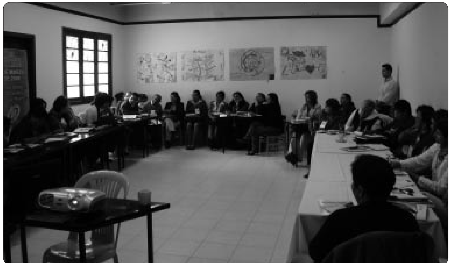
Encuentro de mujeres en el Centro de Atención Laboral en Bogotá, dentro del marco del proyecto "Negociación Colectiva con Perspectiva de Género"

Asegurar el acceso a un trabajo decente, respaldado por marcos legislativos bien implementados, resulta esencial para avanzar hacia la paridad de género y la igualdad de oportunidades.