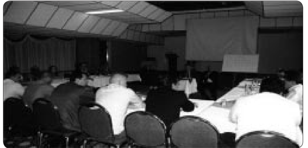
Directores de los departamentos de Educación de las subdirectivas de la CUT y delegados de la escuela de Fecode y de la ENS reunidos en Bogotá para ajustar el Plan Nacional de Trabajo del Departamento de Educación.