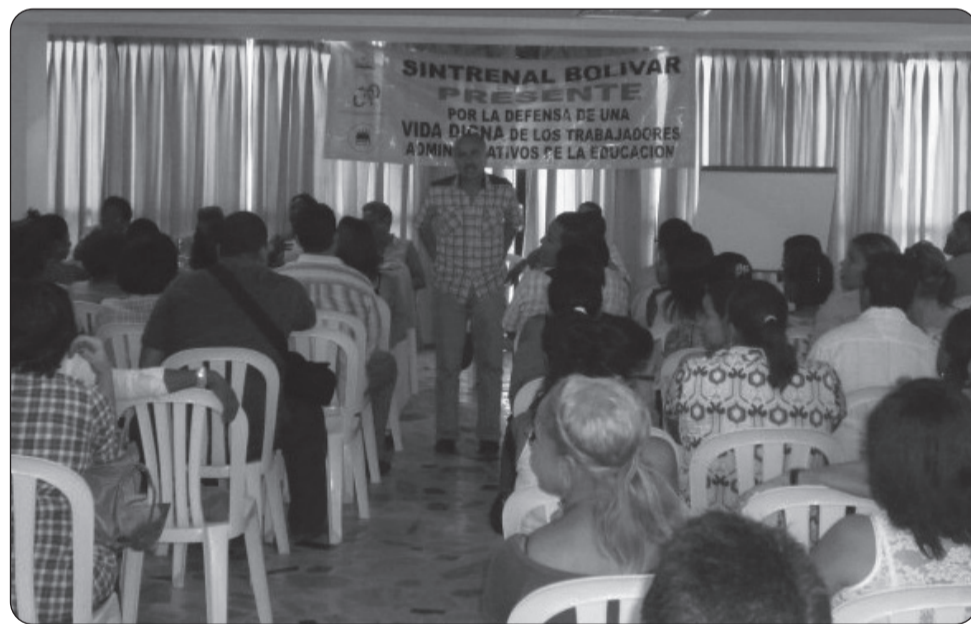
Aspectos de la asamblea de provisionales de Sintrenal Bolívar.