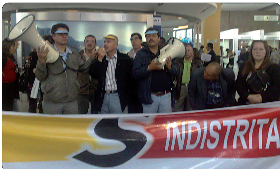
Mitin de los empleados distritales exigiendo negociación de pliego de peticiones al Alcalde Samuel Moreno.