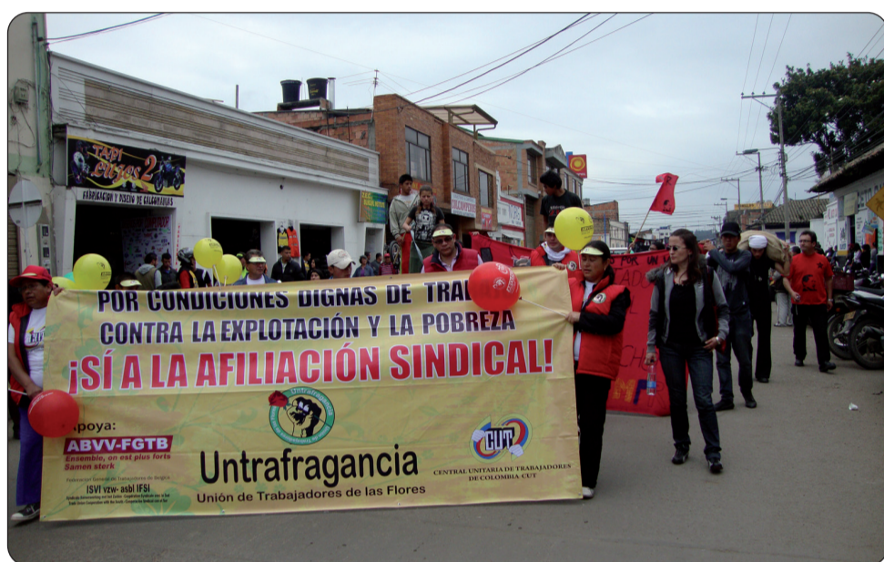
Celebración del 1º de Mayo en Facatativá