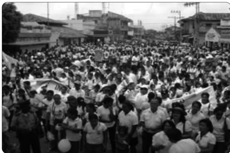
Marcha por la Paz en Montería (Córdoba), convocada por la CUT, Fecode y Ademacor, en contra de la política de exterminio al que está sometido el magisterio de Córdoba y el movimiento sindical.