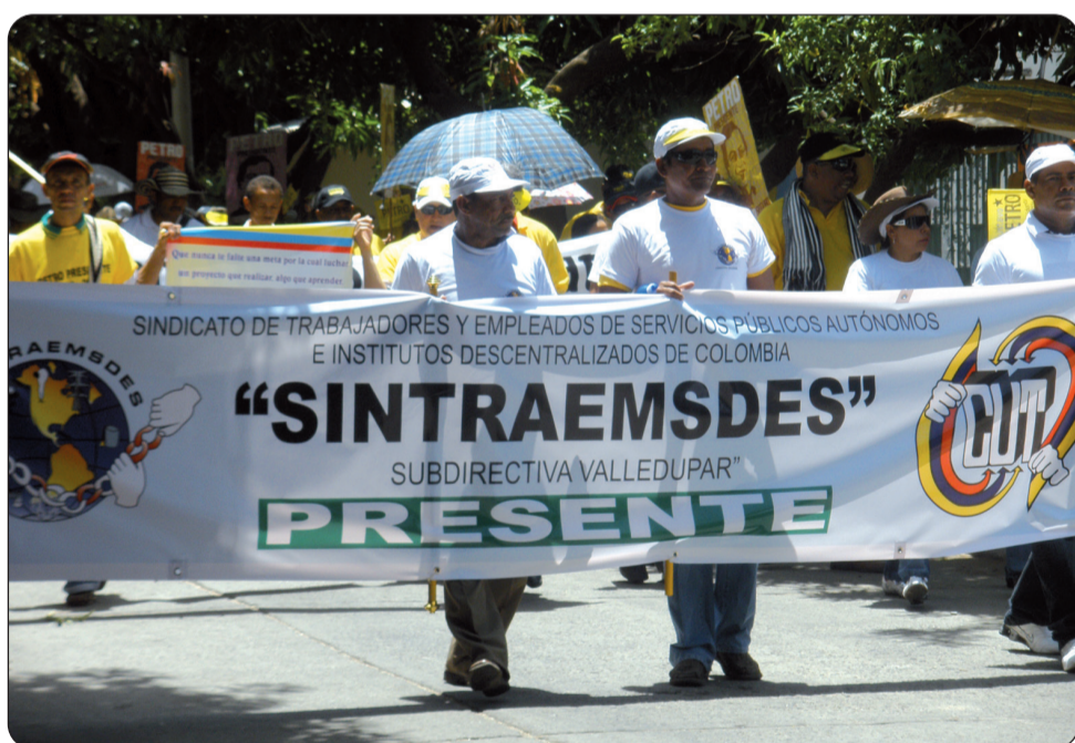
Celebración del 1º de Mayo en Valledupar.