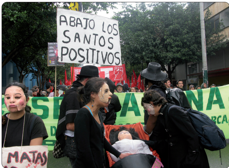
Celebración del 1º de Mayo en Bogotá. La alegría y la parodia.