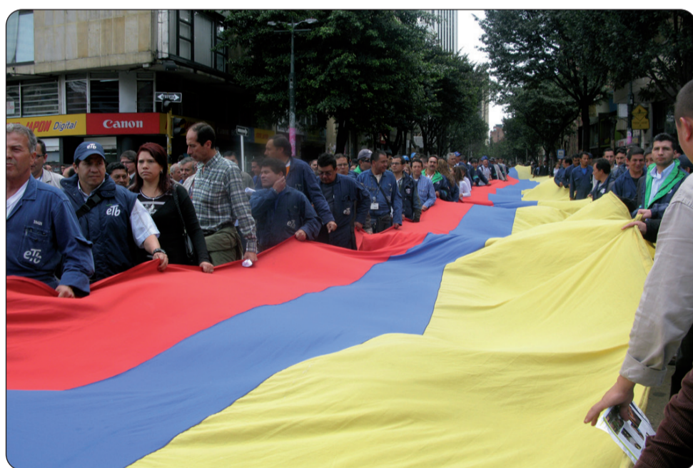
Marcha de los trabajadores de la Empresa de Telecomunicaciones de Bogotá en contra de la privatización, el 18 de mayo.