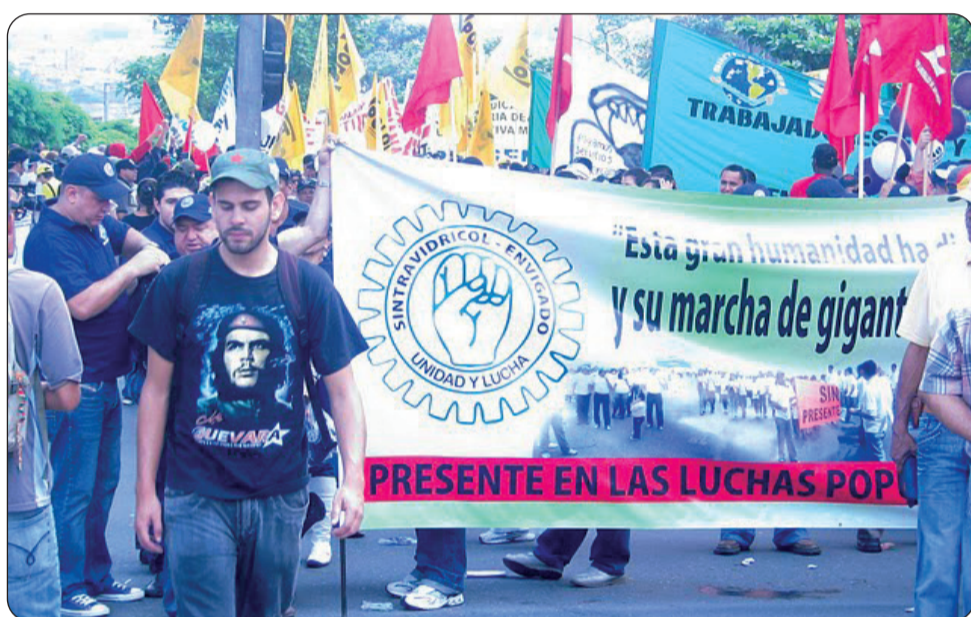
Celebración del 1º de Mayo en Medellín.