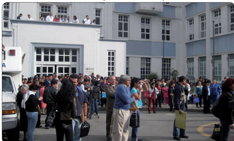
Mitin de los empleados del hospital La Samaritana en contra de la privatización de la Red Hospitalaria en Cundinamarca, el 12 de mayo.