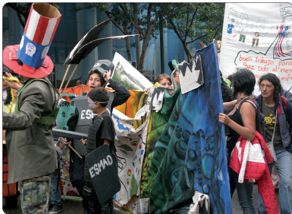
Celebración del 1º de Mayo en Bogotá. De fiesta combativa por las calles de la capital.