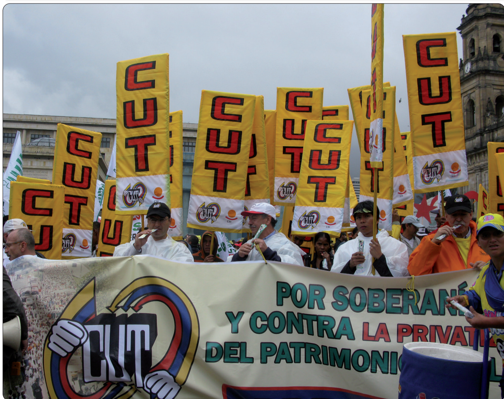
La columna de la CUT haciendo entrada a la Plaza de Bolívar de Bogotá el 1º de Mayo.

En el próximo número espere informe especial