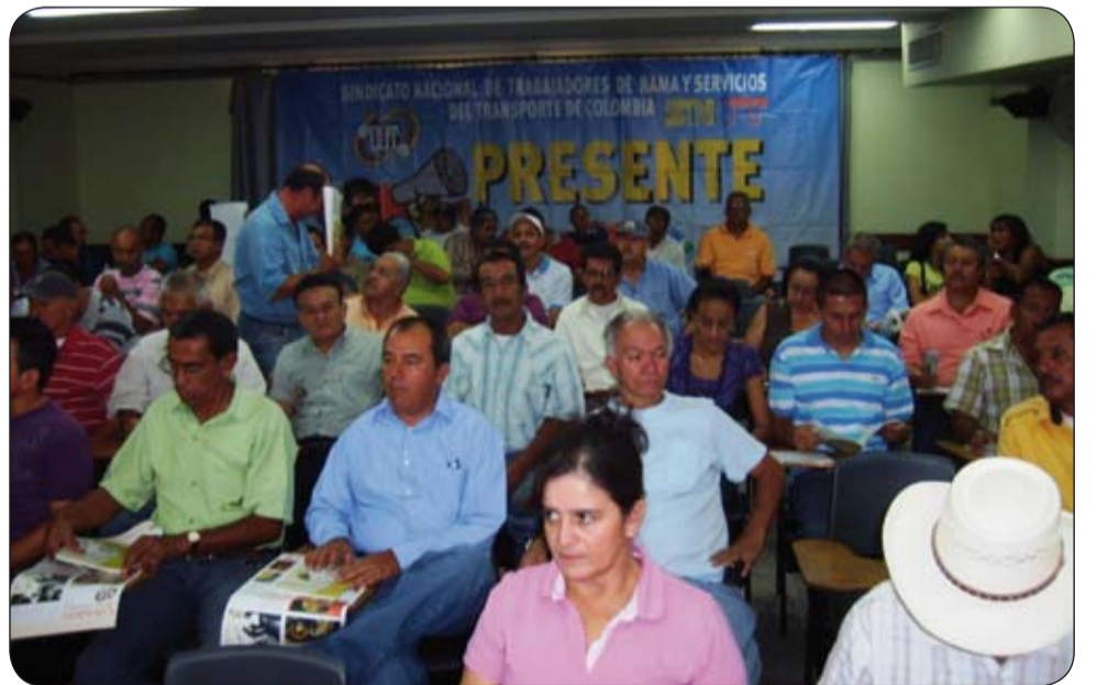
Creacion de la 1a Subdirectiva SNTT en Antioquia.