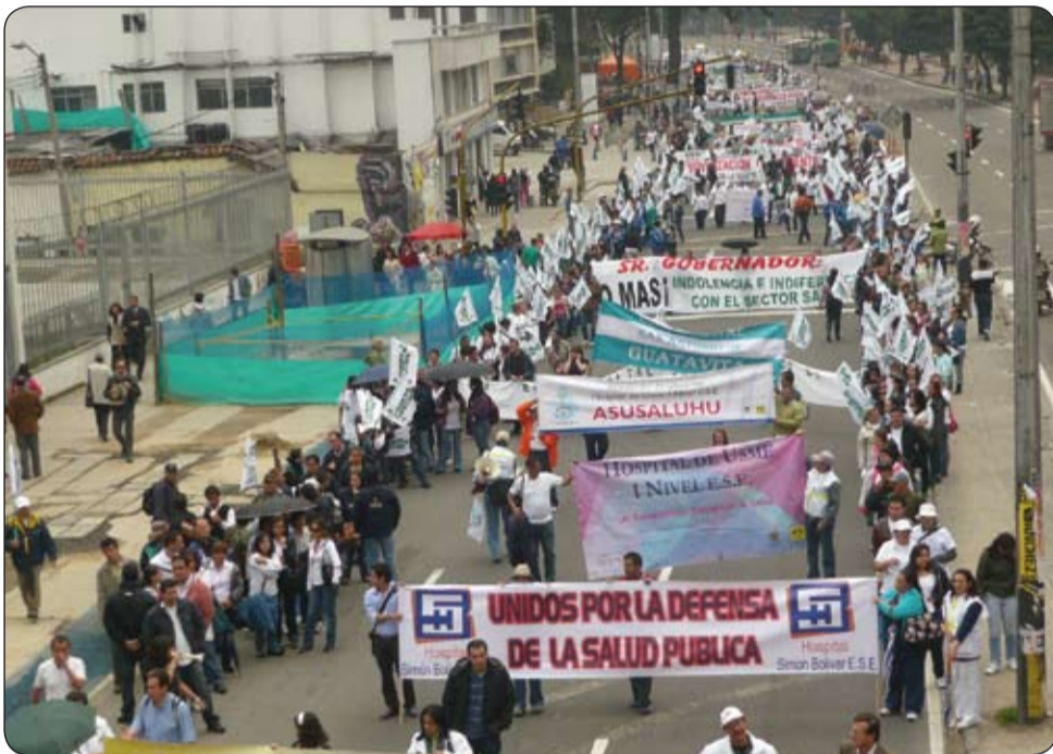
Movilización nacional en defensa de la salud como derecho fundamental, 6 de octubre.