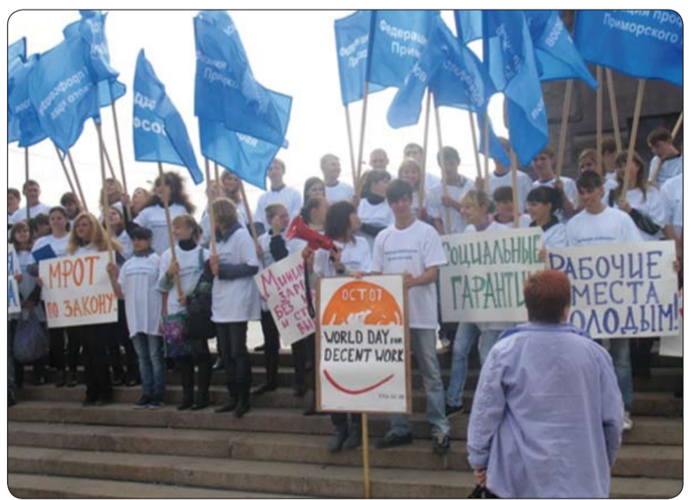
Trabajadores en Atenas, Grecia, en la III jornada mundial por un trabajo decente.