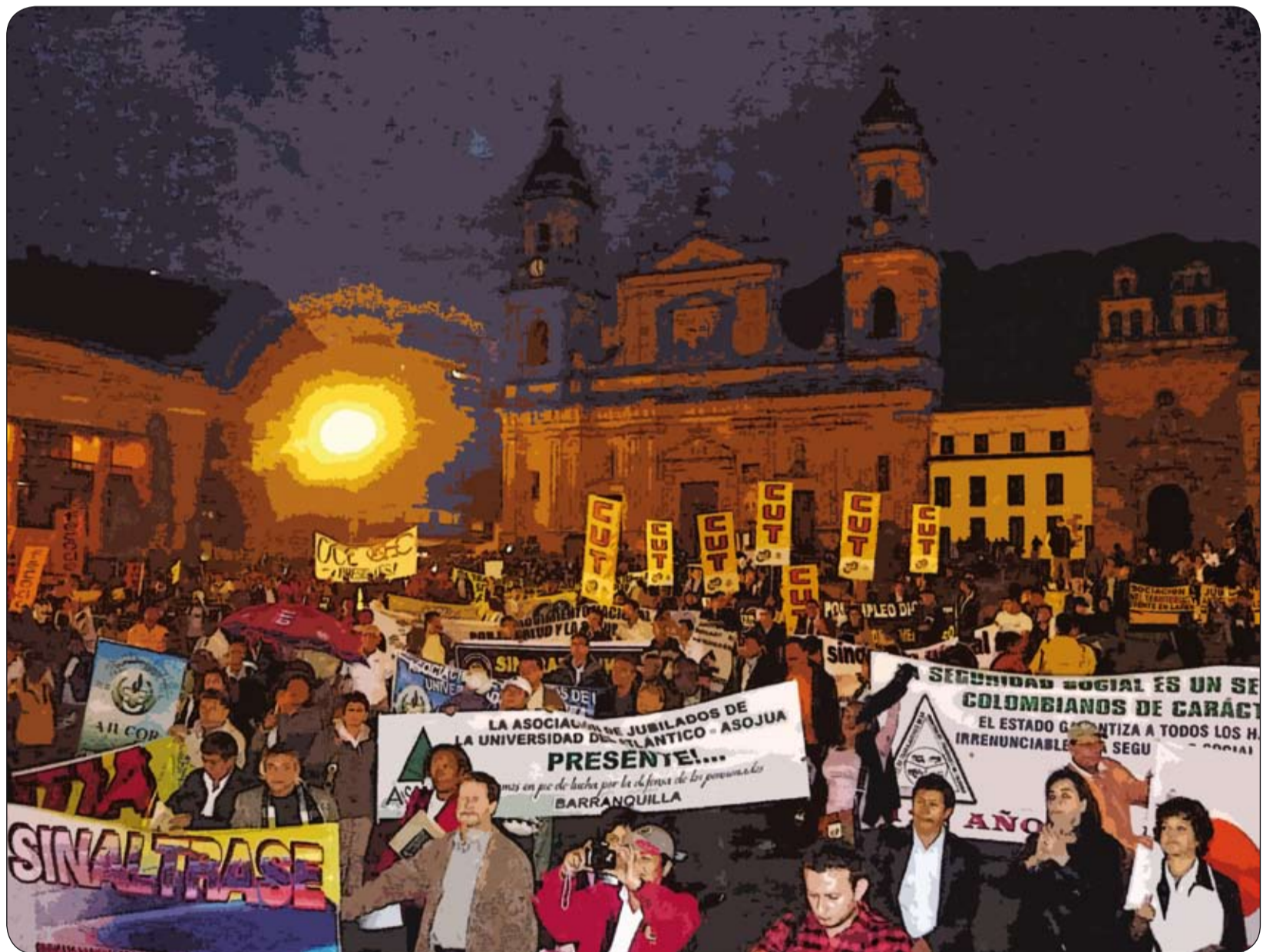
Movilización de los trabajadores bogotanos en la gran Jornada Mundial por Trabajo Decente.