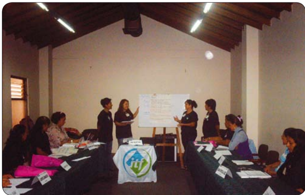
Encuentro de Mujeres del sector transporte en Medellín.

En lo que resta del año le apostaremos a la creación de comité de impulso en algunos departamentos, la afiliación masiva de trabajadores del sector y el año venidero iniciaremos las fusiones y la preparación y presentación de un Pliego marco sectorial al nuevo gobierno.