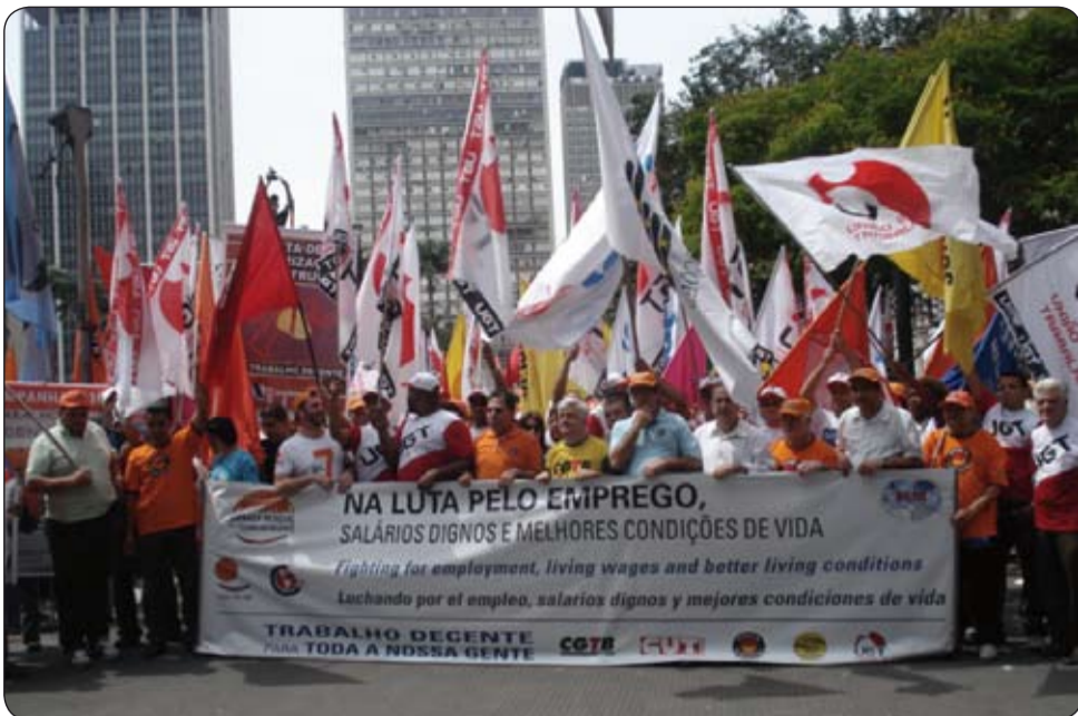
Movilización por trabajo decente en Sao Paulo.