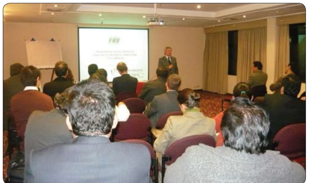
Aspecto del lanzamiento Programa País de la Federación Sindical de Holanda.