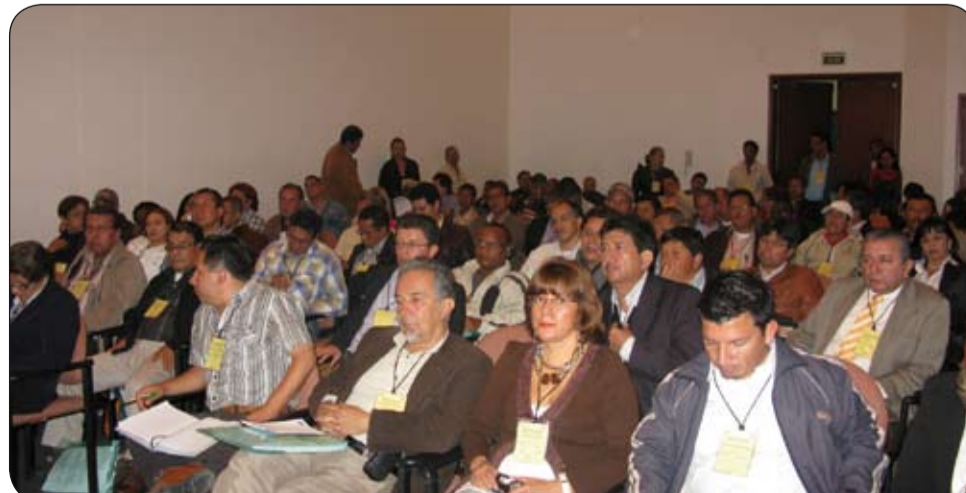
Aspectos de la Junta Nacional de la Central Unitaria de Trabajadores (CUT) realizada en Bogotá, el 2 y 3 septiembre de de 2010.