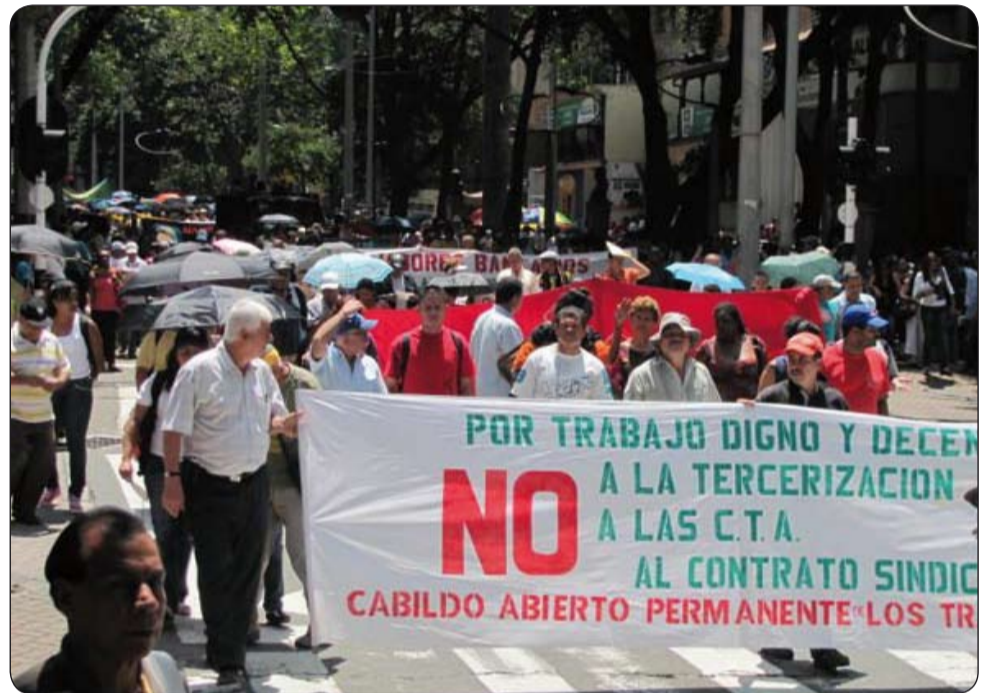
En Medellín, los trabajadores salieron a las calles para exigir trabajo decente.