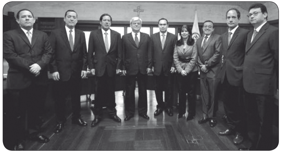
La Corte Constitucional.