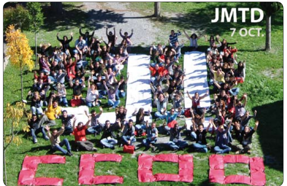
Movilización por trabajo decente en Madrid.