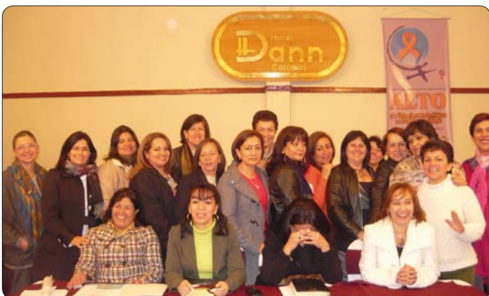
Reunión nacional de directoras Departamento de la Mujer de la CUT.