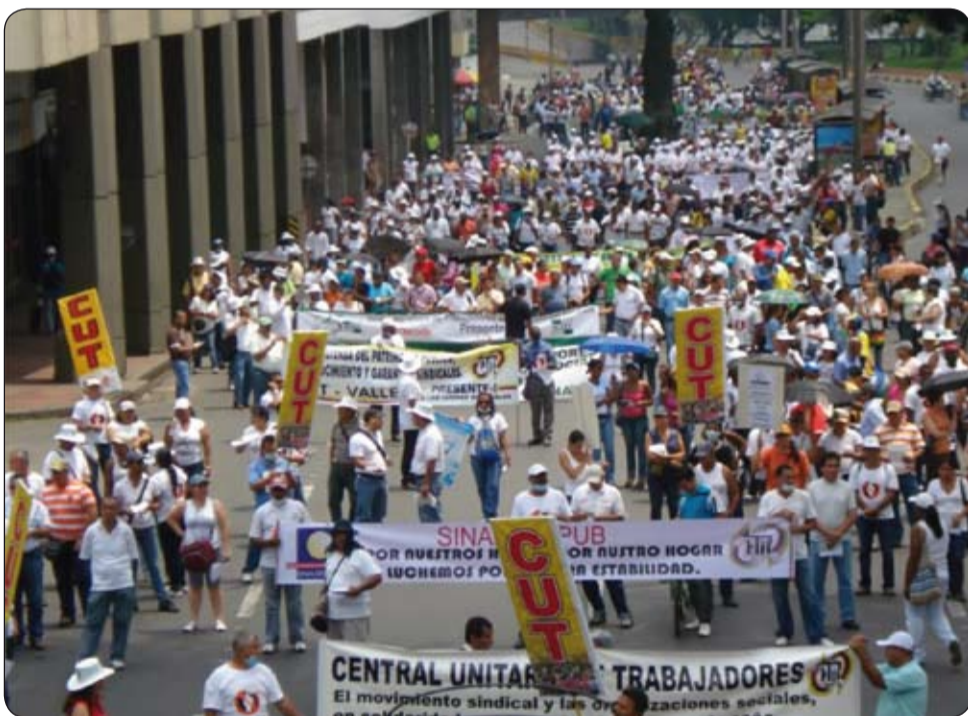
En Cali, los trabajadores también se manifiestaron en las calles para exigir trabajo decente.