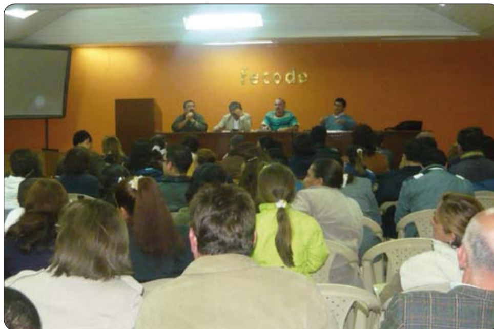
Conversatorio de los empleados provisionales con el senador Luis Carlos Avellaneda.