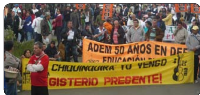
Aspectos de la movilización del magisterio del Bogotá y otras regiones del país.