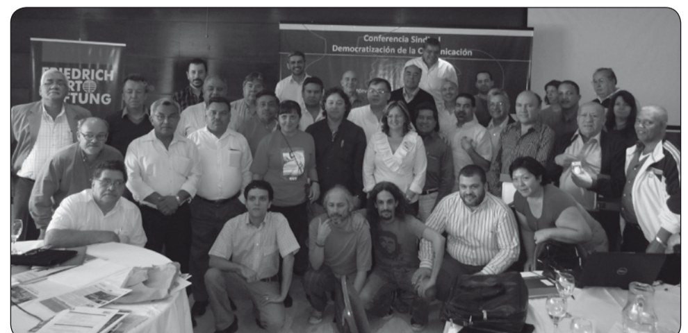
Aspectos de la conferencia Sindical Democratización de la Comunicación.