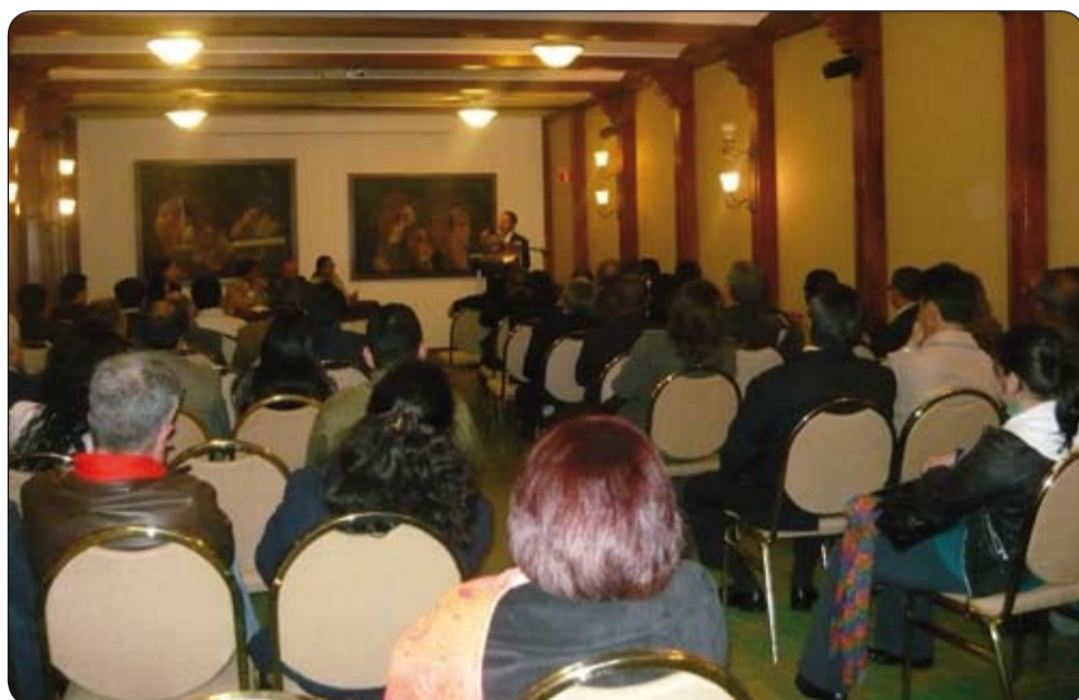
Clausura Programa pasantes AFL CIO- CUT en el Hotel Tequendama.