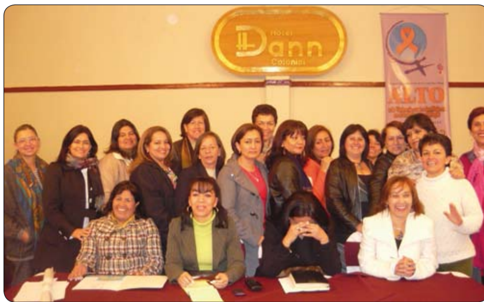
Segundo Encuentro nacional de Departamentos de la Mujer (CUT)