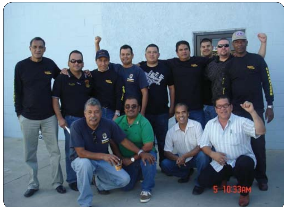
Grupo de pasantes de la CUT Nacional asistentes al evento.

Para mayor comprensión de esta lucha pueden consultar videos en youtube de los siguiente link: http://www.youtube.com/watch?v=vhG1nvNJoQ4 o lucha en el congreso norteamericano de los teamsters. http://www.youtube.com/watch?v=00B9aLOv5po la tv informa la dura realidad de los camioneros en los angeles.