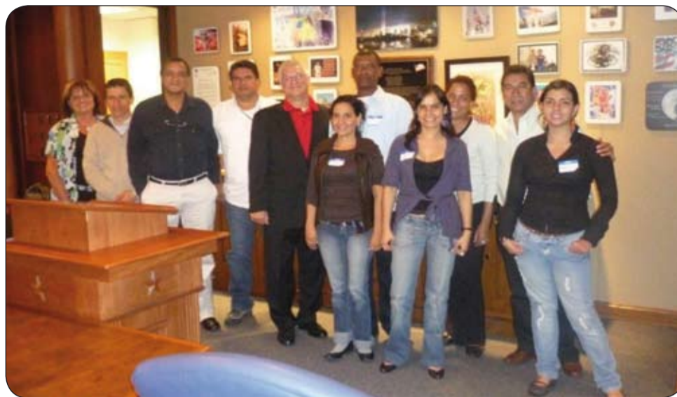
Grupo de pasantes de la CUT Nacional, con el presidente de TCU.

En el año 2002 Los Ángeles y Long Beach son demandadas en corte Federal por daños a la comunidad por la polución que sale de los 13 puertos que pertenecen a estas dos ciudades. En el año 2006 en los Ángeles se presentaron muchos casos seguidos de muertes por problemas respiratorios, grupos ambientalistas la demandaron por la contaminación que producían los puertos, las empresas, refinerías y los camiones viejos en las ciudades de San Pedro y Long Beach, a raíz de esto se crea una gran coalición integrada por 52 organizaciones entre estos grupos ambientalistas, comunidad, intelectuales, estudiantes, grupos religiosos, y los Teamsters, etc. Para hacer realidad la implementación del Plan o Programa de Camiones Limpios (CTP) que en su esencia o componentes principales obliga a las empresas de transporte de carga: