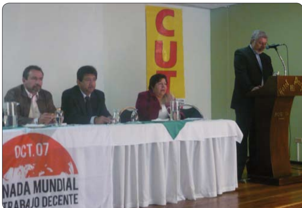
Instalación del Seminario Elaboración de una propuesta sobre trabajo decente en el Hotel Parque.