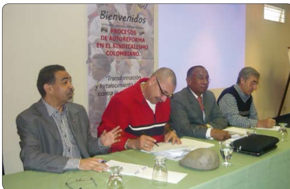
Seminario Procesos de autoreforma en el sindicalismo colombiano.