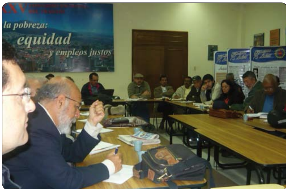
Reunión Gran Coalición Democrática haciendo un balance del proceso de movilización social y Político en Colombia.