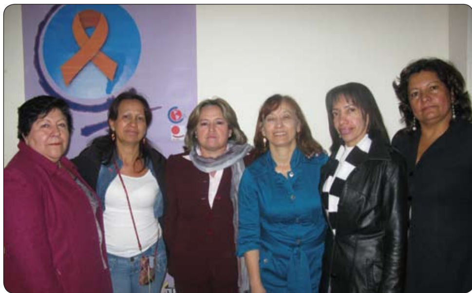
25 de noviembre, Día internacional de la Eliminación de la violencia contra la mujer, la CUT con diversos actos culturales conmemora esta fecha.