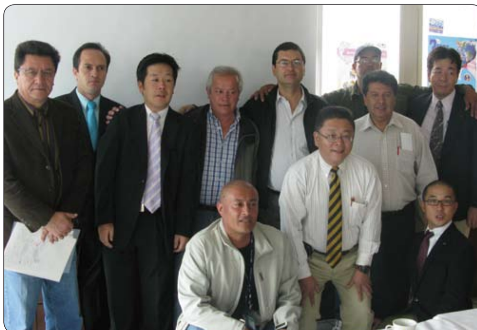
Sindicalistas japoneses de SOTECTSU de visita en la CUT.