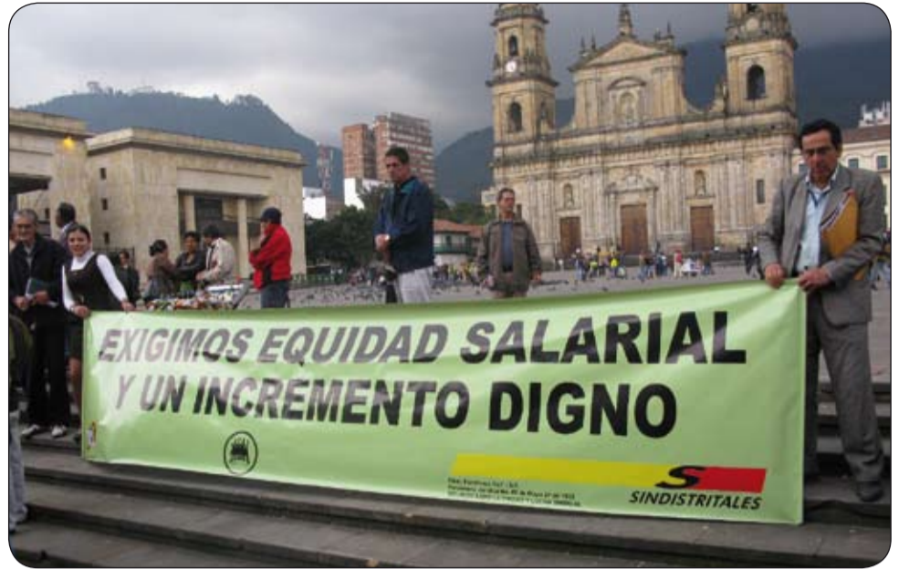
Empleados públicos distritales presentaron el pasado 10 de febrero, asesorados por la CUT, el pliego de peticiones al alcalde mayor de Bogotá.