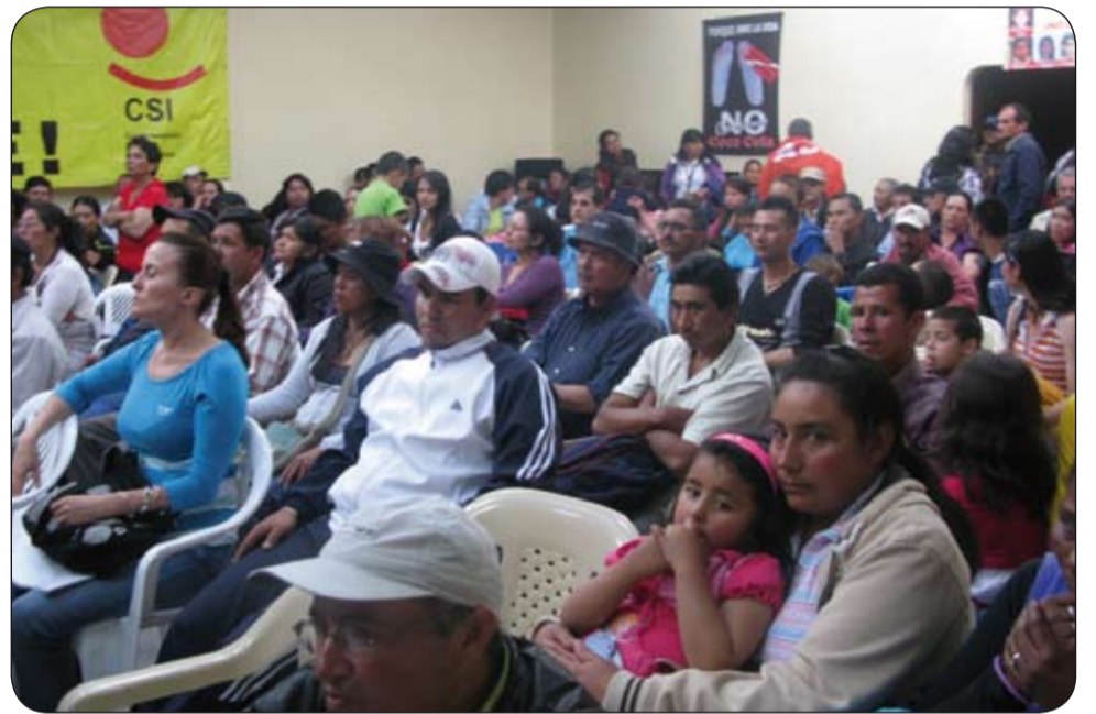
Celebración del Día de los Trabajadores de las Flores, el pasado 14 de febrero en Facatativá.