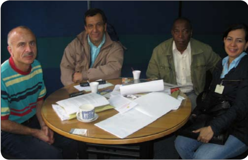
La CUT organizó el Plebiscito Nacional en defensa de la estabilidad laboral de 120 mil empleados públicos en provisionalidad.