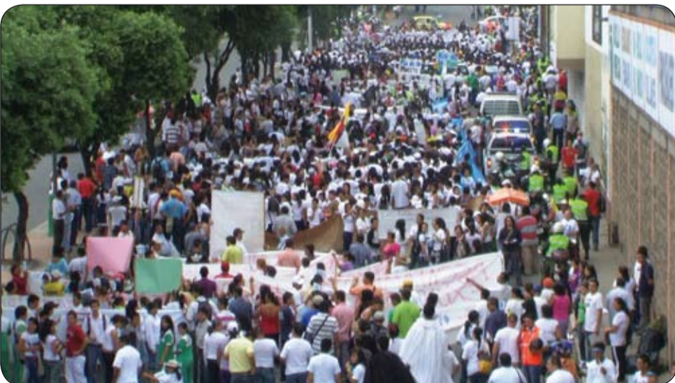
La CUT invita a todos los trabajadores a defender el patrimonio nacional y a unirse a todas las movilizaciones contra proyectos minero-energéticos, como el caso de la minería a cielo abierto en el Páramo de Santurbán.