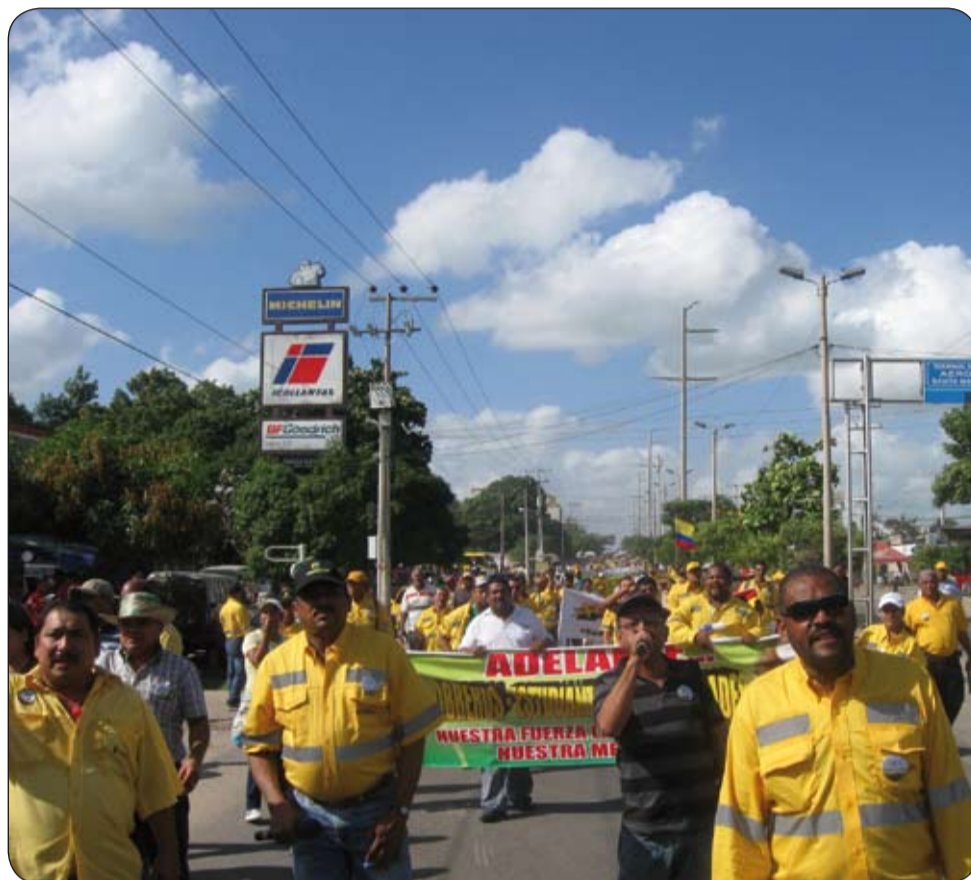
Trabajadores de Sintracarbón durante la negociación en Riohacha.

La lucha demostró que la unidad, la organización, la vinculación con otros sectores sociales y la decisión de los trabajadores, fueron decisivas para la consecución de nuestras conquistas. Que ello es así, nos lo indican las movilizaciones adelantadas