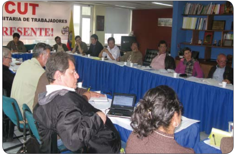
La Gran Coalición Democrática define su plan de movilización para los próximos meses.