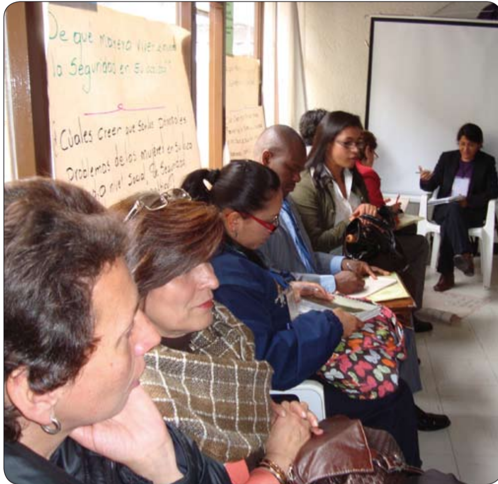
La CUT rendirá un homenaje a todas las mujeres trabajadoras del país y a destacadas sindicalistas.

Ante esta situación el Departamento de la Mujer de la CUT, rechaza las políticas de cooperativas de trabajo asociado y la formalización del empleo, que lejos de crear empleo, contribuyen a devaluar aun más las escasas garantías laborales; desde el año 2009 el Observatorio del Departamento Mujer, Empleo e Ingreso, viene alertando sobre las condiciones más precarias del empleo de las mujeres: el trabajo a tiempo parcial, el desempleo, la informalidad, las brechas salariales entre hombres y mujeres y las escasas oportunidades de empleo; así como la ubicación