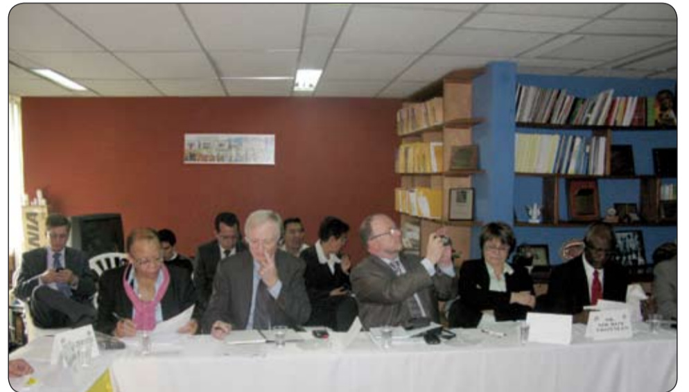
Representantes de la Misión de Alto Nivel de la OIT a Colombia.