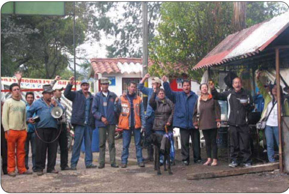
La CUT llama a la solidaridad para los compañeros trabajadores de las flores de Sintrasplendor quienes llevan más de 80 días en un paro indefinido.