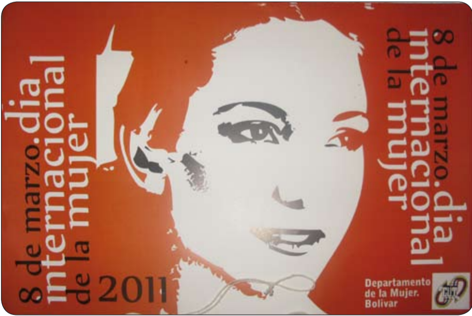
Afiche del Día de la Mujer CUT.